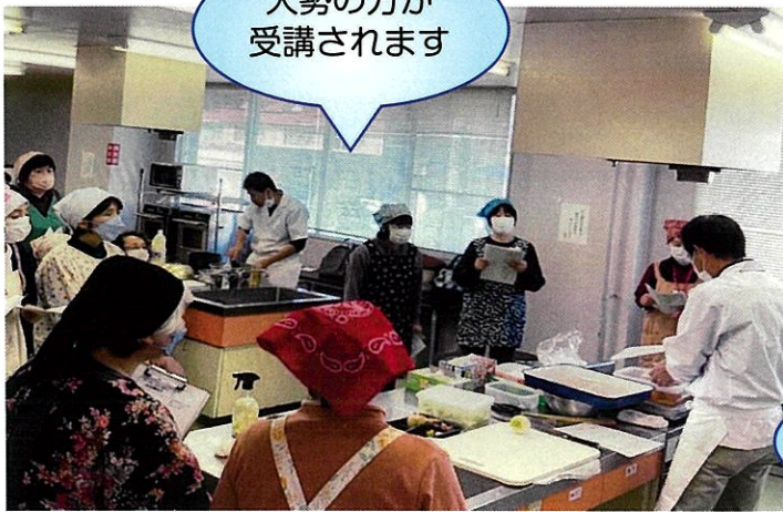
初任者・中堅者セミナー