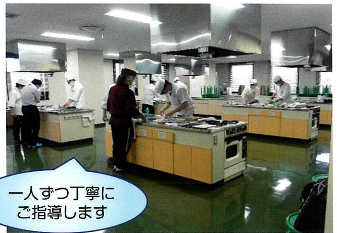
ふぐ処理者認定試験準備講習会