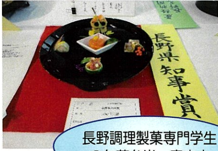
長野調理製菓専門学生の旬菜弁当 審査中